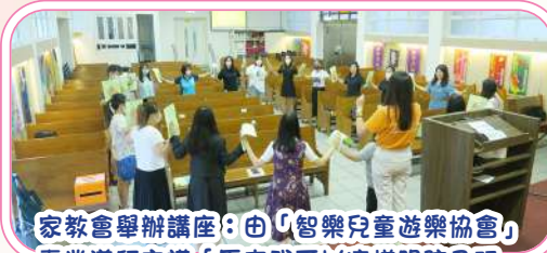
家教會舉辦講座：由「智樂兒童遊樂協會」專業導師主講「原來我可以這樣跟孩子玩」