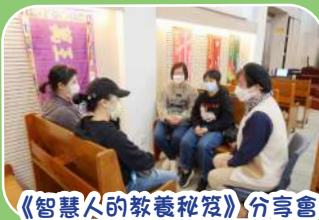
《智慧人的教養秘笈》分享會