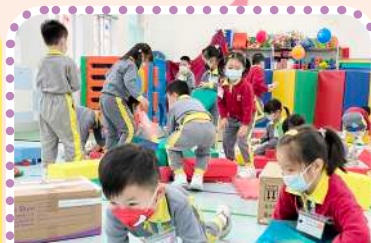
高班在自由遊戲中，使用豐富的物件進行自創的活動