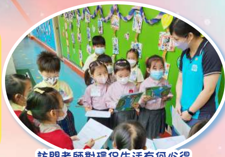
訪問老師對環保生活有何心得