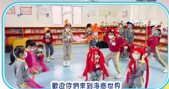
歡迎你們來到海底世界