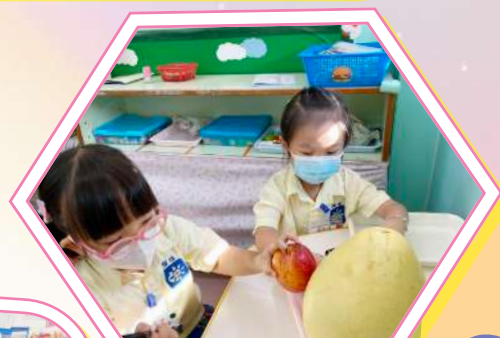
原來水果的皮都有不同的質感