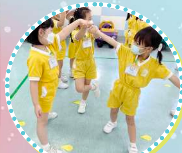
我們合力創作特別的建築物