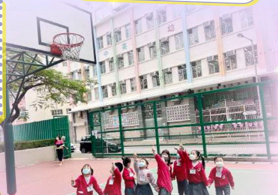
原來公園有個籃球場