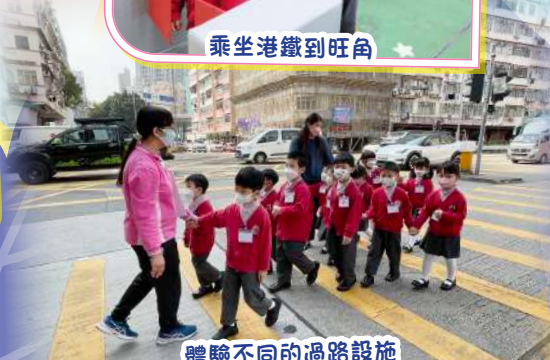
體驗不同的過路設施