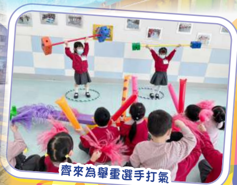
齊來為舉重選手打氣