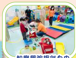
智樂學院提供自由遊戲示範

教師認識自由遊戲的概念和技巧、嘗試在各級班別實踐自由遊戲的知識和技巧，以持續發展及推動自由遊戲，讓幼兒主導、自主、自發進行自由遊戲，從而提升幼兒的探索精神及解難能力。