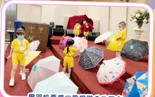
學習投票選出最受歡迎的雨傘