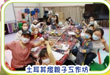
土耳其燈親子工作坊