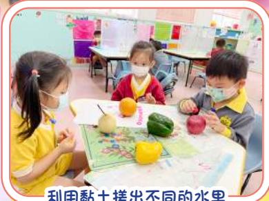
利用黏土搓出不同的水果