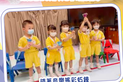
隨著音樂搖彩虹鐘