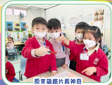
原來磁鐵片真神奇