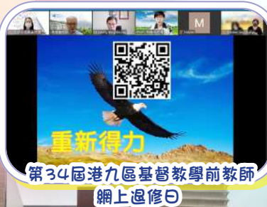
第34屆港九區基督教學前教師網上退修日