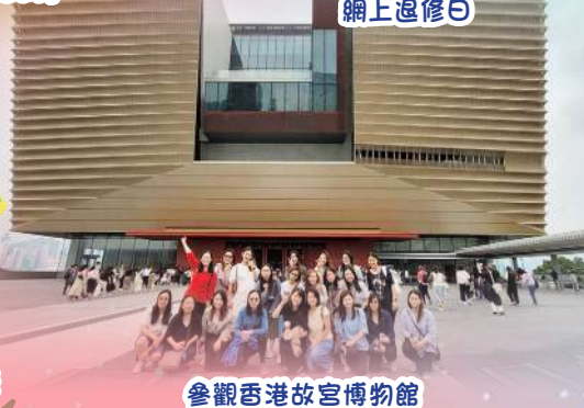
參觀香港故宮博物館