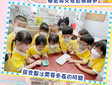
探索製冰需要多長的時間