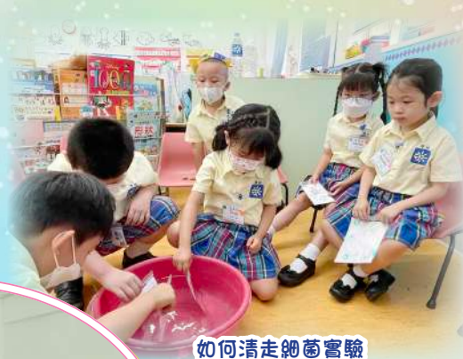
如何清走細菌實驗