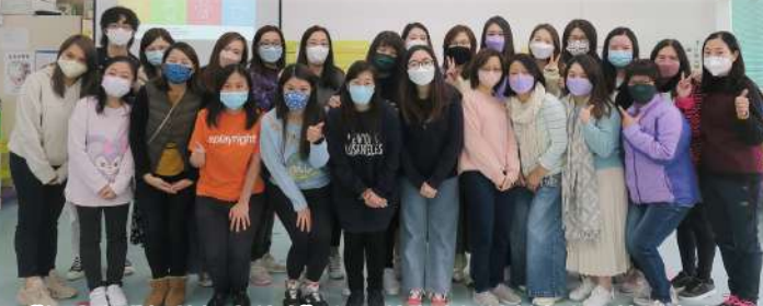
《智樂安妮馬登智樂學院》種子學校培訓計劃自由遊戲工作坊

學校安排教師參加校外及校內不同機構舉辦的工作坊或講座，如參觀香港故宮博物館，持續擴闊教師的藝術視野，增加教師認識中國藝術文化和歷史、智樂《安妮馬登智樂學院》種子學校培訓計劃，藉此認識自由遊戲的概念和技巧等。透過不同工作坊及講座豐富老師的專業知識，以保持優化教學質素，建立專業型學習團隊。