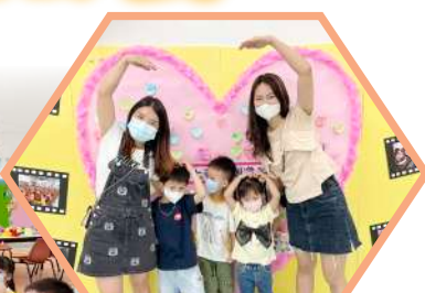
透過藝術欣賞表達感恩