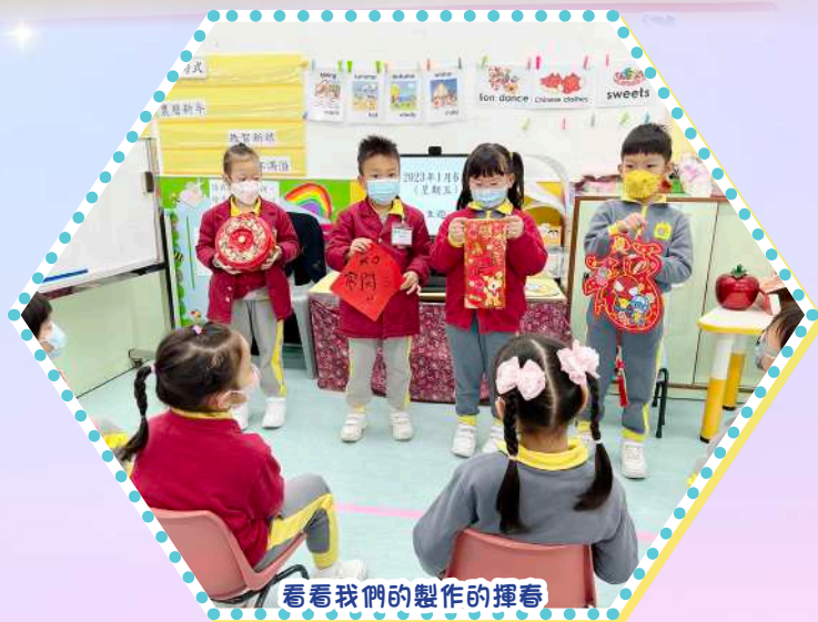
看看我們的製作的揮春