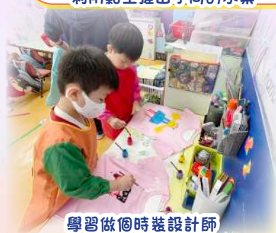
學習做個時裝設計師