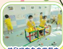
幼兒班在自由遊戲中發揮創意