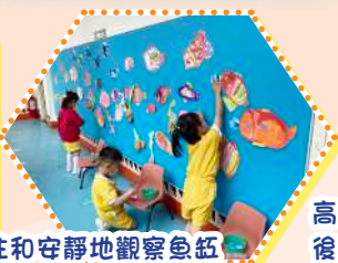
高班的幼兒探索和觸摸不同物料，然後選取自己喜歡的物料創作鯨魚，最後合力製作海洋世界的壁報