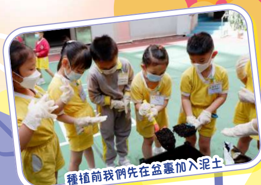
種植前我們先在盆裏加入泥土