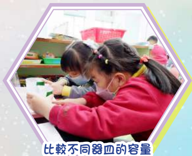
比較不同器皿的容量

在每天的學習裏，老師都會安排不同形式的遊戲和探索活動，激發幼兒的好奇心，讓他們對事物產生不同的興趣，令學習加添動力。