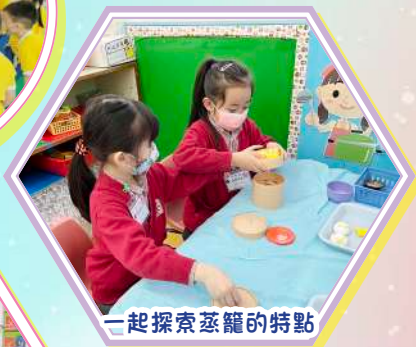
一起探索蒸籠的特點