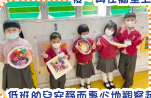
低班的兒安靜而專心地觀察蔬菜的外形，然後再創作美味的食物盤