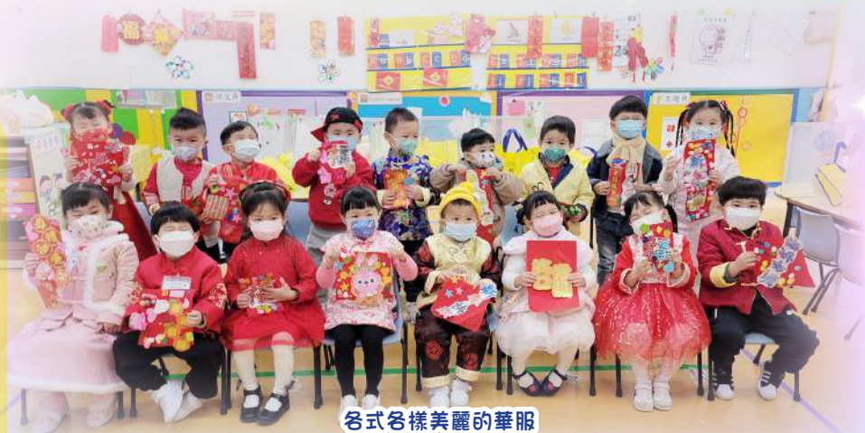
各式各樣美麗的華服

為幫助幼兒認識和感受中國文化，透過主題學習、生活體驗、親子活動等，將中國文化的學習元素融入課堂活動，例如：讓幼兒進行升旗禮、穿華服，品嚐中國點心，並親手製作中國傳統的湯圓、花燈、揮春、剪紙和水墨畫等，設計多元化的素材和學習活動，讓幼兒享受其中的學習樂趣。