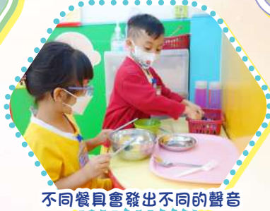
不同餐貝會發出不同的聲音