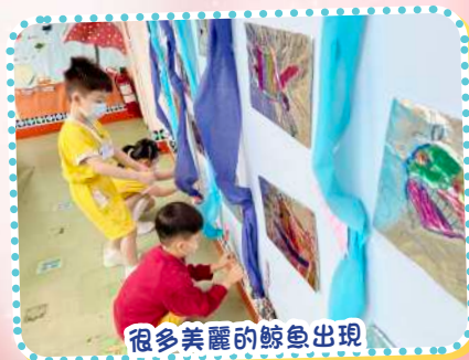
很多美麗的鯨魚出現