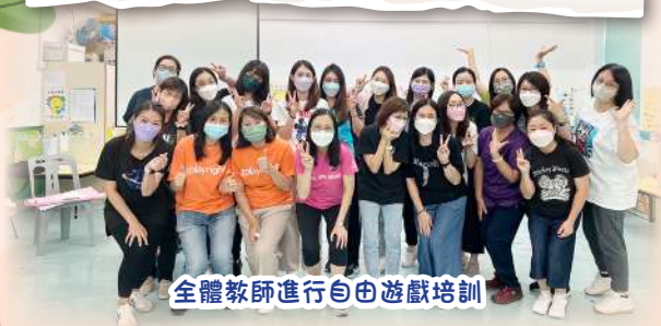
全體教師進行自由遊戲培訓