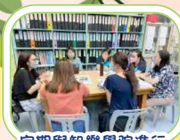
定期與智樂學院進行檢討和修正