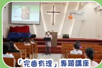
「完齒有理」專題講座