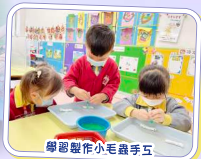
學習製作小毛蟲手