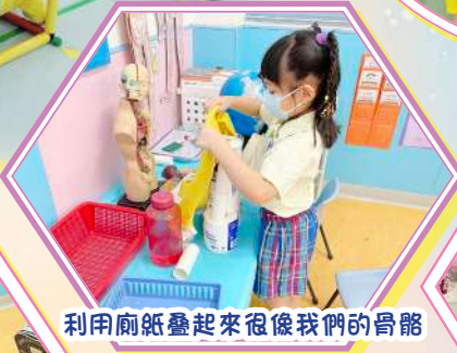
利用廁紙疊起來很像我們的骨骼