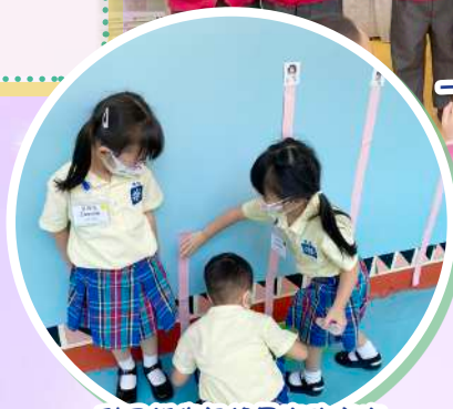
利用紙條記錄量度的高度