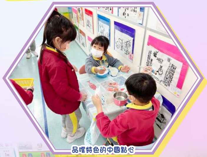
品嚐特色的中國點心