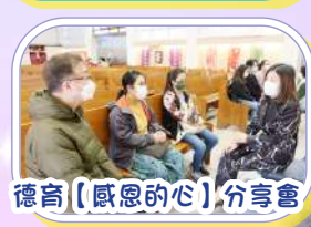
德育【感恩的心】分享會