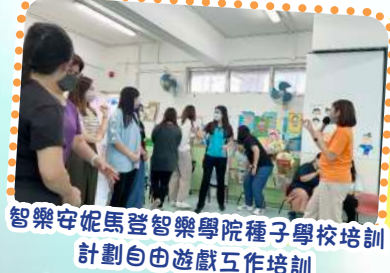
智樂安妮馬登智樂學院種子學校培訓計劃自由遊戲工作坊