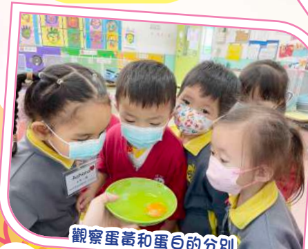
觀察蛋黃和蛋白的分別