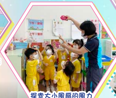
探索大小風扇的風力