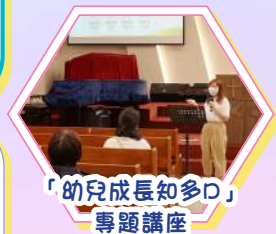
「幼兒成長知多D」專題講座