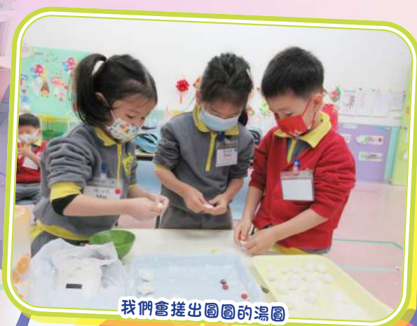
我們會搓出圓圓的湯圓