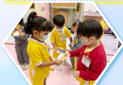
一起合作砌水果圖案