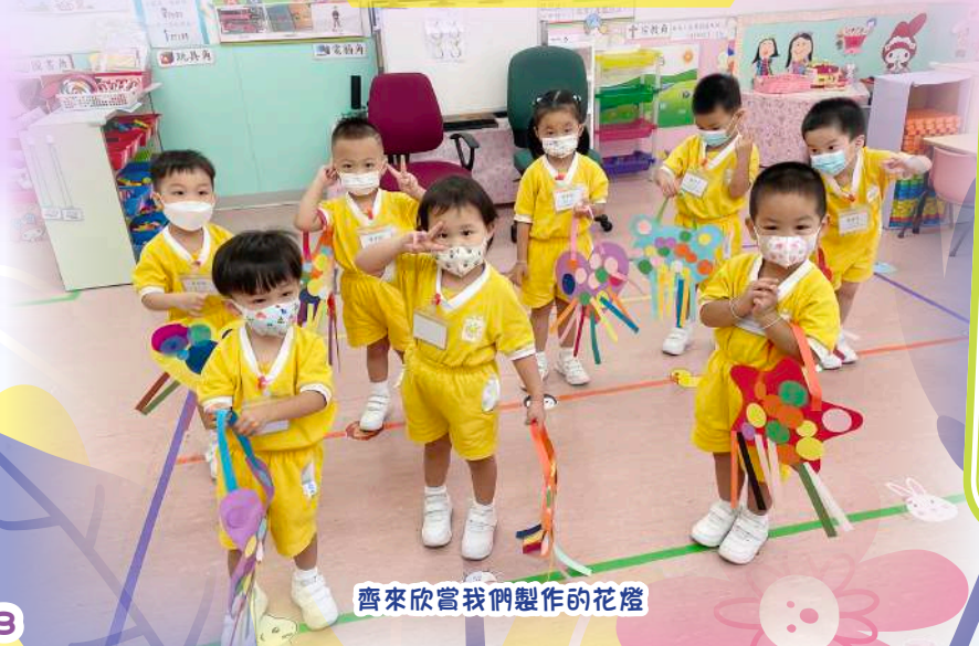
齊來欣賞我們製作的花燈