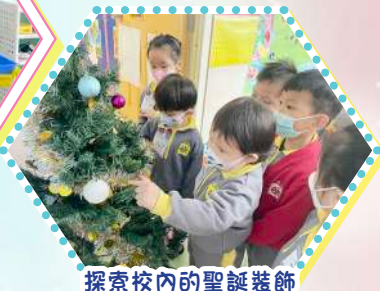
探索校內的聖誕裝飾