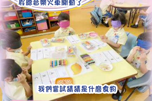
我們嘗試猜猜是什麼食物