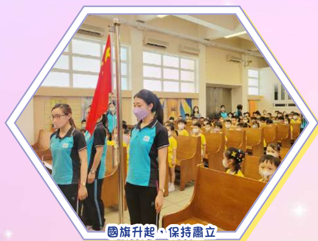
國旗升起，保持肅立