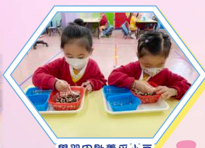
學習用匙羹舀小豆