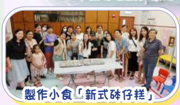
製作小食「新式砵仔糕」