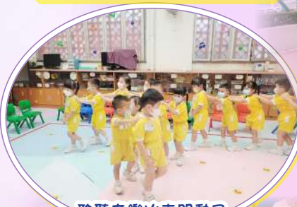
聆聽音樂火車開動了