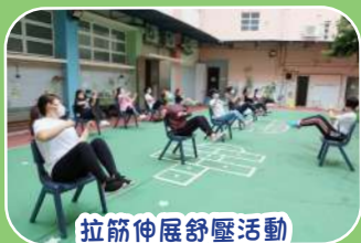
拉筋伸展舒壓活動