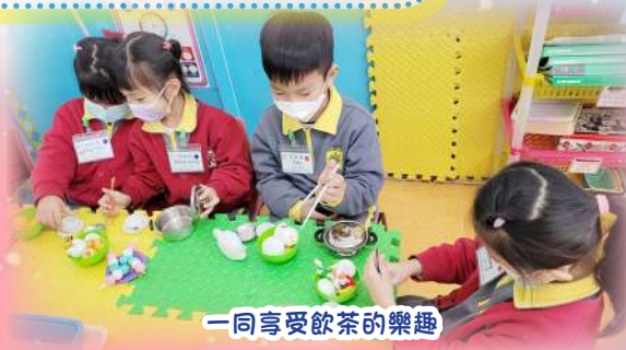
一同享受飲茶的樂趣