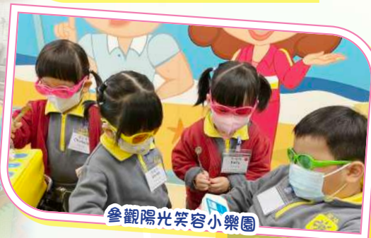
參觀陽光笑容小樂園