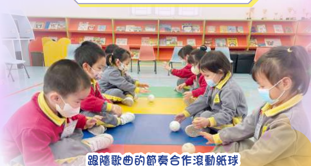
跟隨歌曲的節奏合作滾動紙球