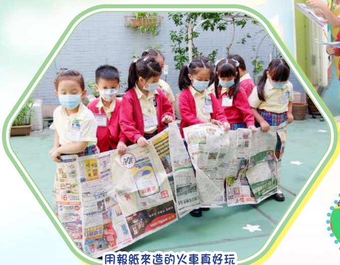
用報紙來造的火車真好玩