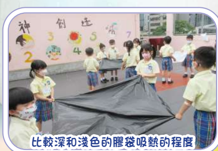
比較深和淺色的膠袋吸熱的程度