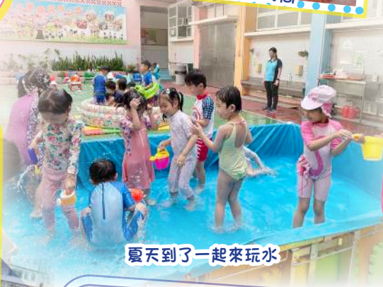
夏天到了一起來玩水