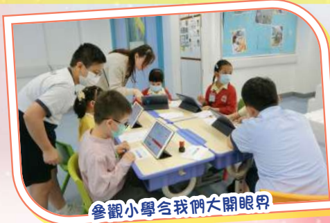
參觀小學令我們大開眼界