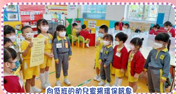
向低班的幼兒宣揚環保訊息