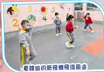
看誰做的紙飛機飛得最遠