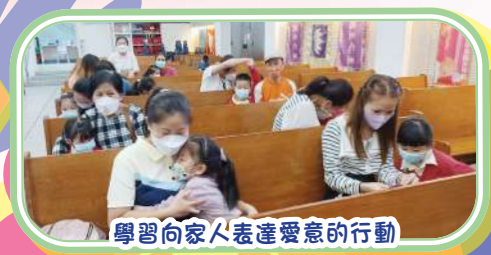
學習向家人表達愛意的行動