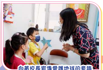
向黃校長宣傳愛護地球的意識