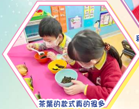
茶葉的款式真的很多