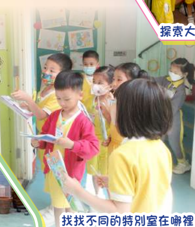
找找不同的特別室在哪裡