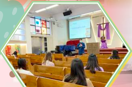
循道衛理楊震社會服務處主講：「家暴與兒童身心成長」教師培訓講座