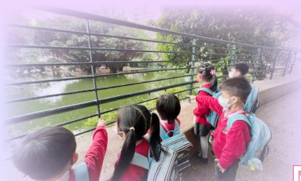
你看！天父所創造的巨鯢真美麗啊！