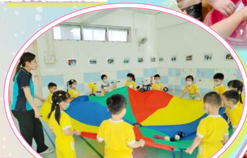
如何讓小球不被拋出外