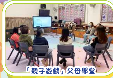
「親子遊戲」父母學堂