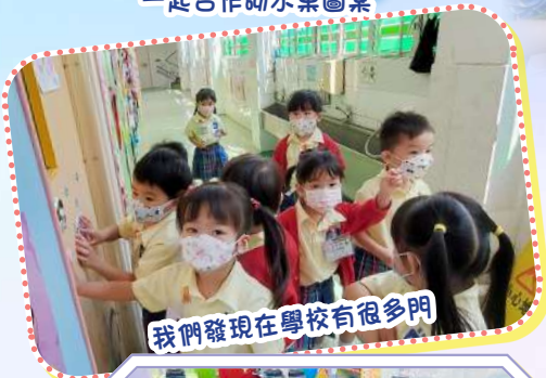
我們發現在學校有很多門