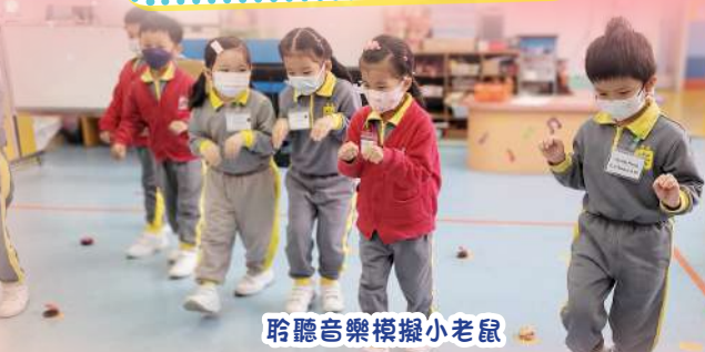
聆聽音樂模擬小老鼠