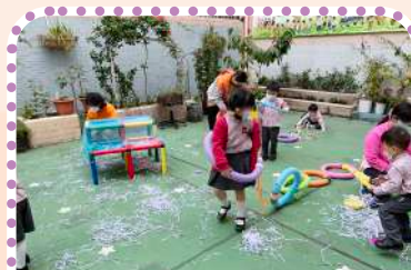
低班透過自由遊戲探索不同的物料