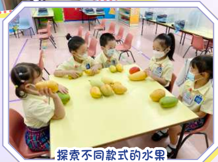
探索不同款式的水果