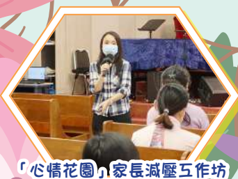
「心情花園」家長減壓工作坊