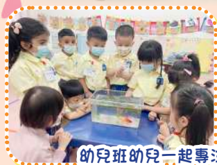
幼兒班的兒一起專注和安靜地觀察魚缸後，再在牆壁上創作美麗的魚缸