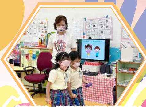
「愛家護孩」機構媽媽教導我們幫助別人