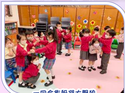
一同合作躲避大野狼