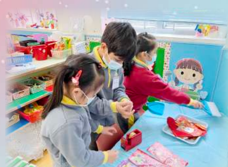
一同佈置課室迎新年