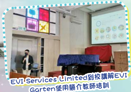
EVI Services Limited到校講解EVI Garten使用簡介教師培訓