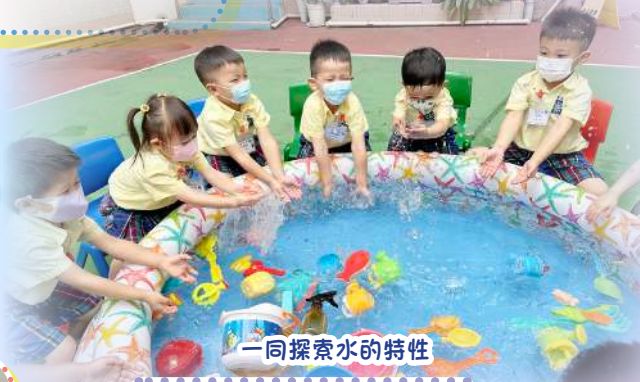
一同探索水的特性