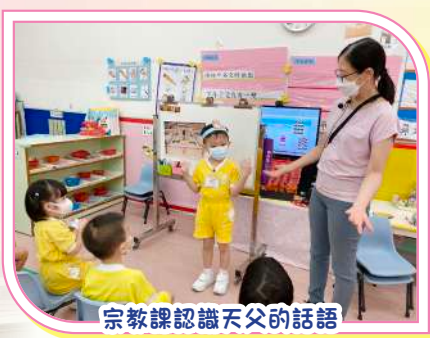
宗教課認識天父的話語