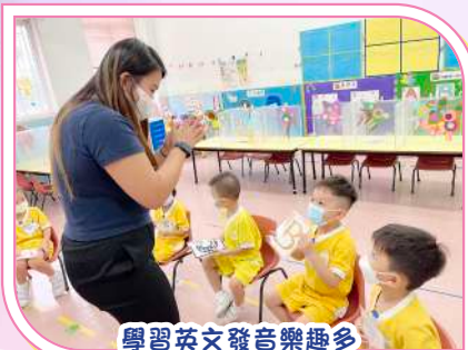
學習英文發音樂趣多