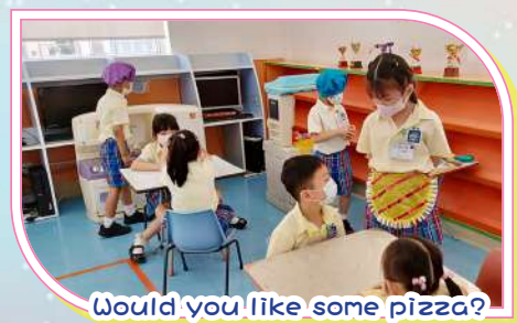
Would you like some pizza?