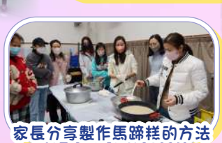
家長分享製作馬蹄糕的方法