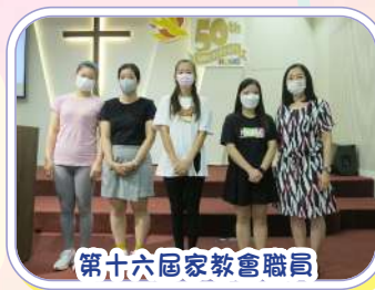
第十六屆家教會職員

本年度為第十六屆家長教師會，家長教師會職員定期與學校共同商討及籌辦不同的親子活動，促進學校與家長之間的聯繫，建立家長、教師之間的良好關係外，更攜手建立正向的思維。