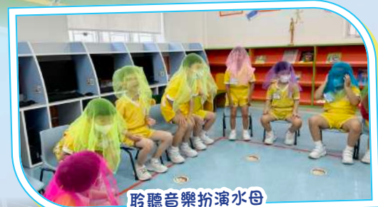
聆聽音樂扮演水母