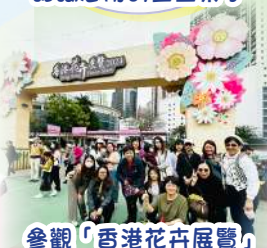
參觀「香港花卉展覽」