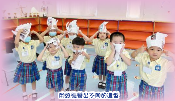
用紙張變出不同的造型