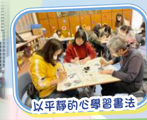
以平靜的心學習書法