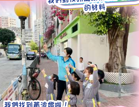
我們找到葛波燈啦！