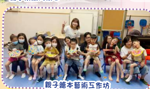
親子繪本藝術工作坊