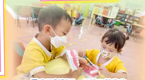
要用牙刷刷牙，保持口腔衛生