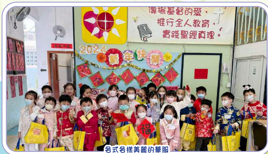
各式各樣美麗的華服