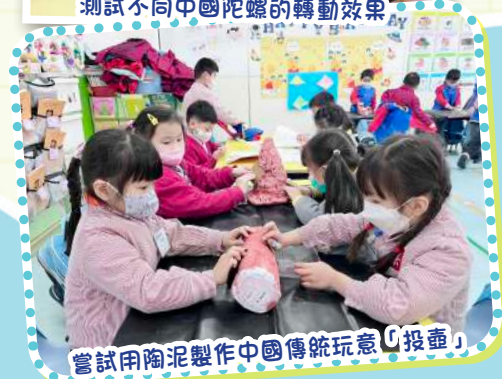
嘗試用陶泥製作中國傳統玩意「投壺」