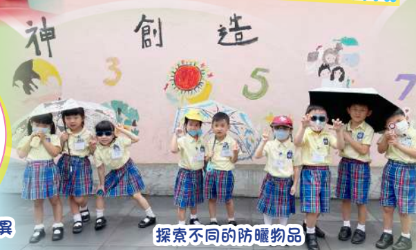
探索不同的防曬物品