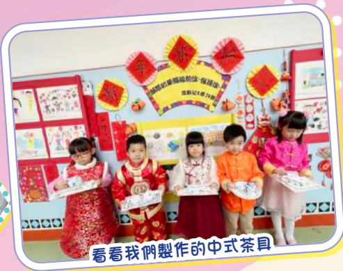
看看我們製作的中式茶具