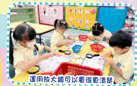
運用放大鏡可以看得更清楚