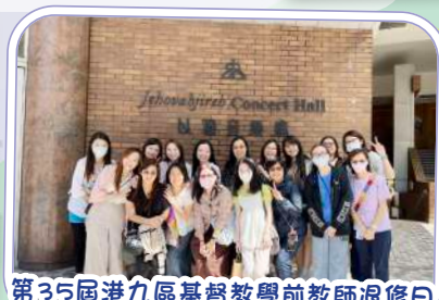
第35屆港九區基督教學前教師退修日