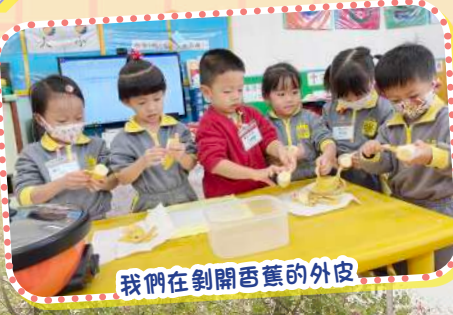
我們在剝開香蕉的外皮