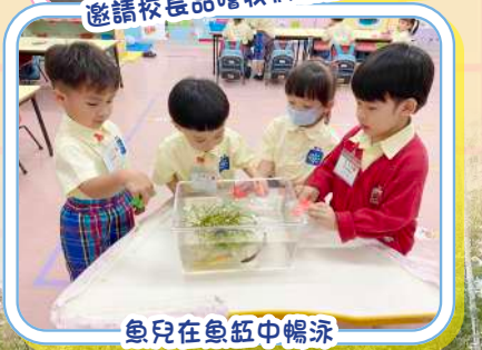
魚兒在魚缸中暢泳