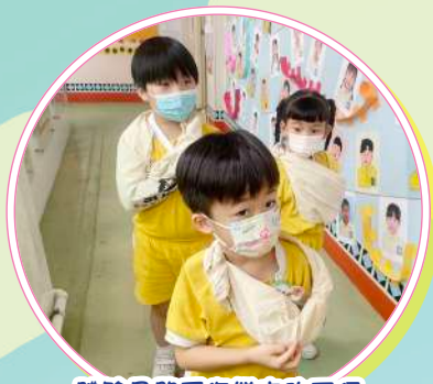
體驗骨節受傷帶來的不便