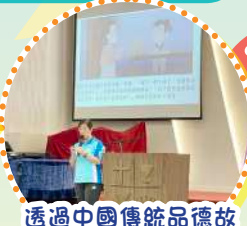
透過中國傳統品德故事《宋濂守信》學習做個順服好寶寶