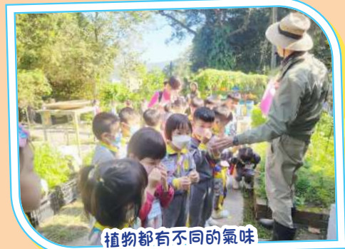
植物都有不同的氣味