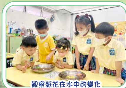
觀察紙花在水中的變化