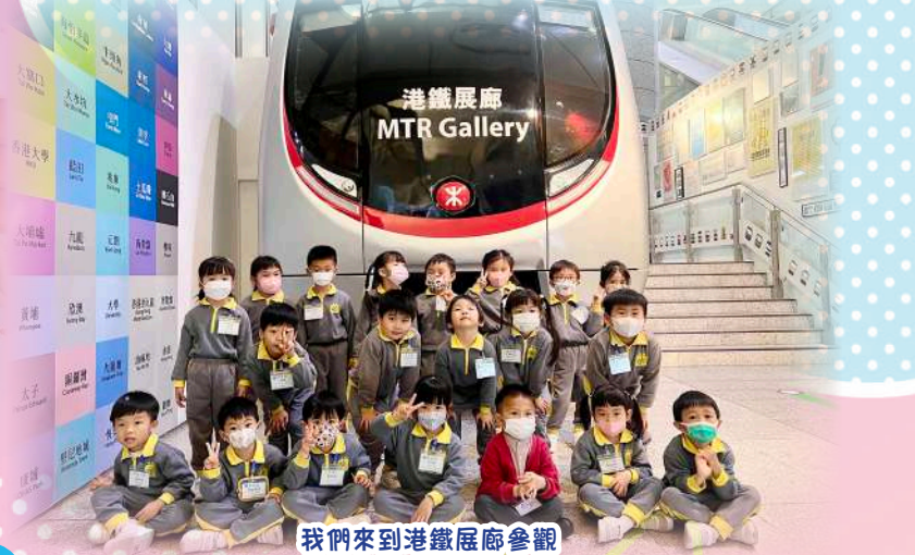
我們來到港鐵展廊參觀