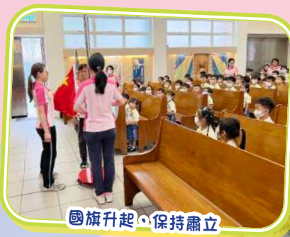
國旗升起，保持肅立