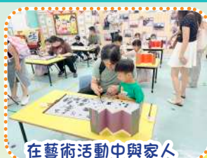
在藝術活動中與家人體驗中國書法