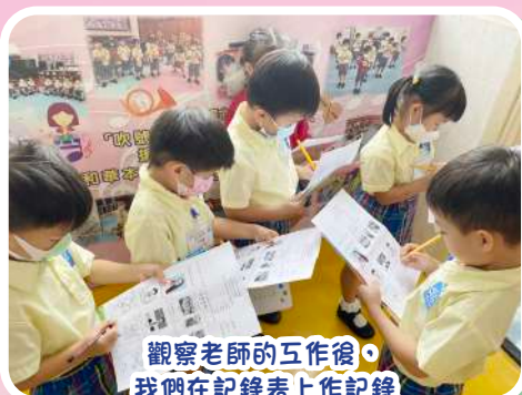
觀察老師的互作後，我們在記錄表上作記錄