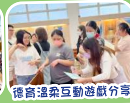
德育溫柔互動遊戲分享