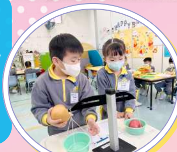
嘗試用天秤比較水果的重量