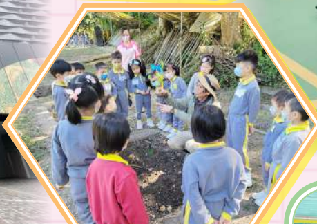
農夫為我們示範移苗的技巧