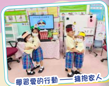
學習愛的行動——擁抱家人