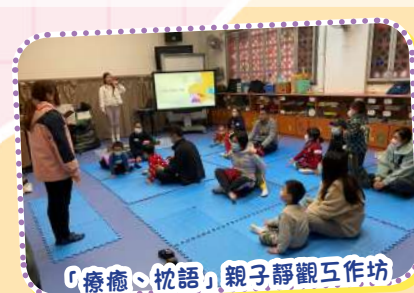
「療癒、枕語」親子靜觀工作坊