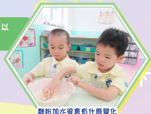
麵粉加水後會有什麼變化