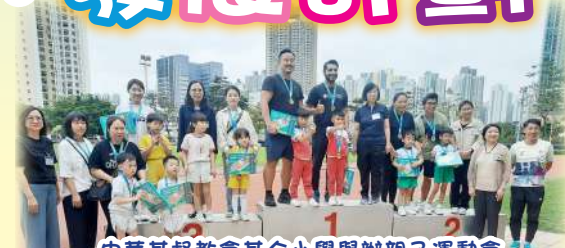
中華基督教會基全小學舉辦親子運動會