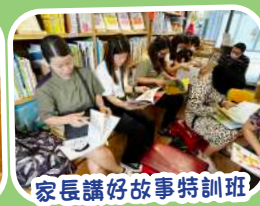
家長講好故事特訓班