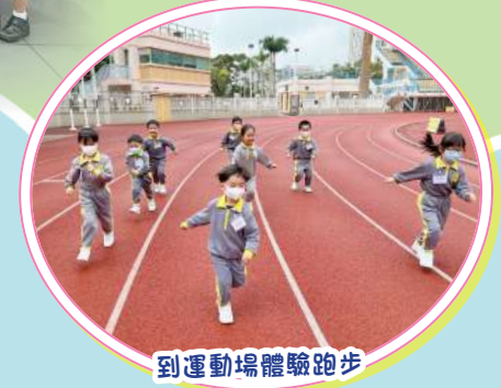
到運動場體驗跑步