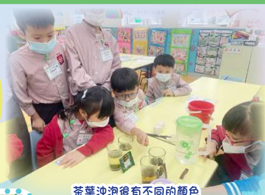
茶葉沖泡後有不同的顏色