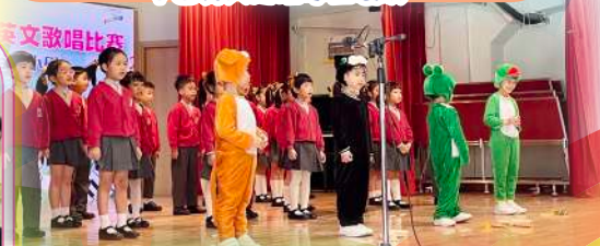
2024全港幼稚園英文歌唱比賽