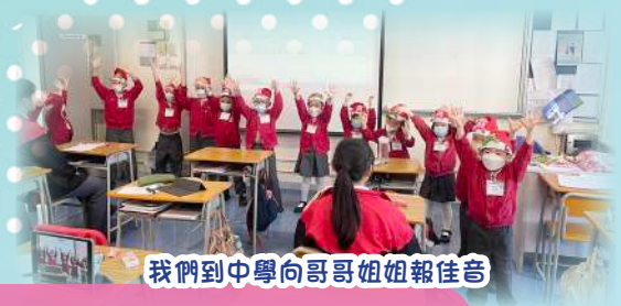
我們到中學向哥哥姐姐報佳音