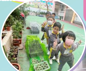
我們用綠色的網來保護小菜苗