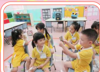
彼此分享兒時的相片