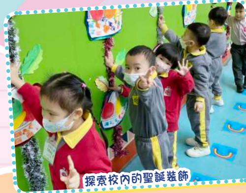
探索校內的聖誕裝飾