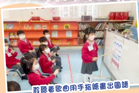
聆聽着歌曲用手指繪畫出圖譜