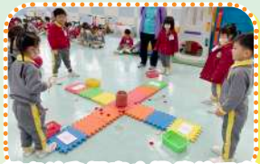
低班幼兒探索中國傳統玩意——「投壺」的玩法