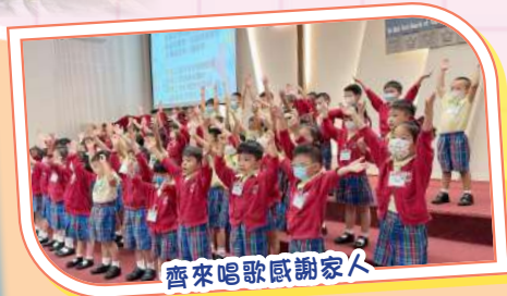
齊來唱歌感謝家人