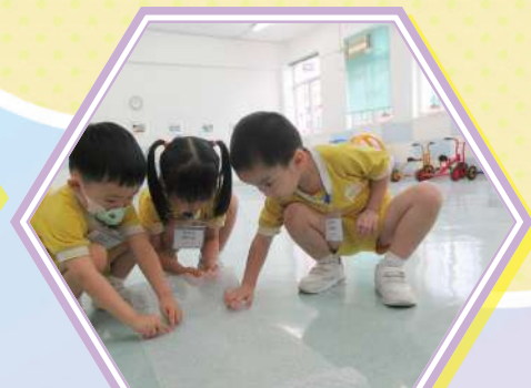
用手指按泡泡紙真好玩