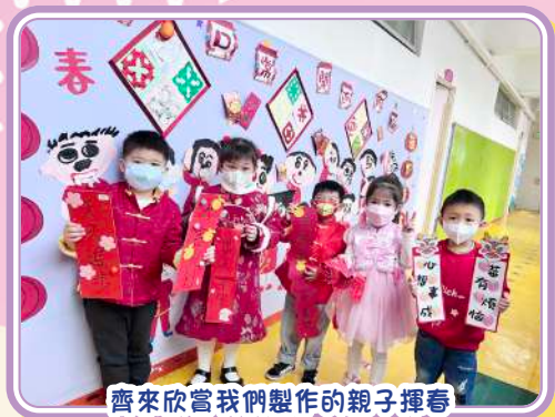
齊來欣賞我們製作的親子揮春