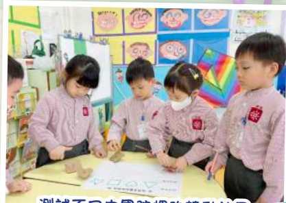
測試不同中國陀螺的轉動效果