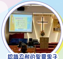
認識忍耐的聖靈果子

「家福小組」是一個關注家長的需要，為家長提供多元化的活動，定期提供多元化的興趣及教育活動，興趣活動包括書法班、美食分享、生日會、戶外觀賞等，從中舒緩家長的壓力，促進家長身心靈健康及彼此交流。更舉行繪本講座及講好故事工作坊，從中讓家長學習講故事的技巧，建立良好的親子關係。