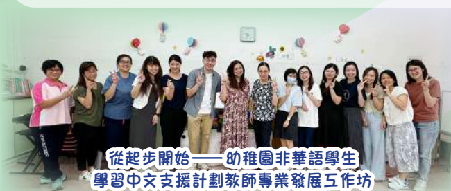
從起步開始——幼稚園非華語學生 學習中文支援計劃教師專業發展工作坊