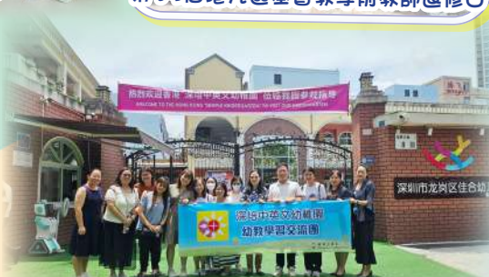
幼教學習交流團（深圳）