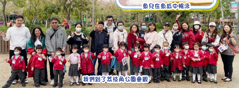
我們到了荔枝角公園參觀