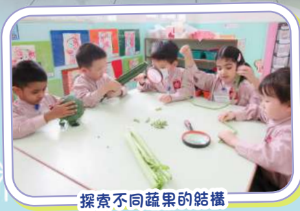
探索不同蔬果的結構