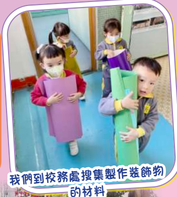
我們到校務處搜集製作裝飾物的材料