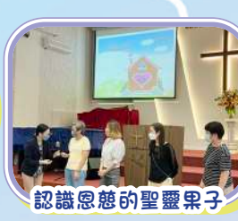
認識恩慈的聖靈果子