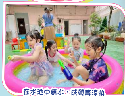
在水池中嬉水，感覺真涼快