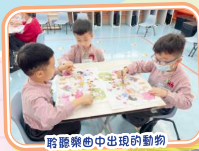
聆聽樂曲中出現的動物