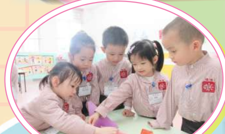
探索不同紙張摺出來的紙飛機外形有否相異