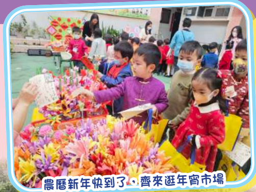
農曆新年快到了，齊來逛年宵市場