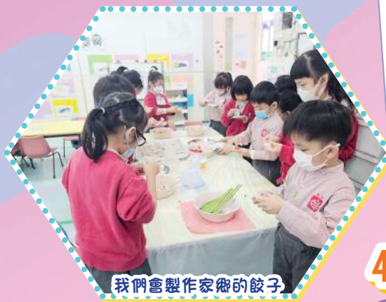
我們會製作家鄉的餃子