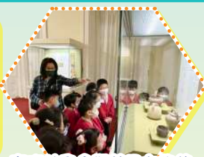
高班幼兒參觀茶具文物館，認識中國品茗文化