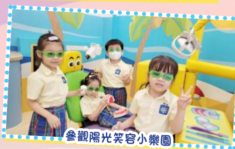
參觀陽光笑容小樂園