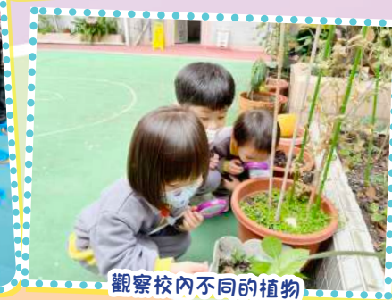
觀察校內不同的植物