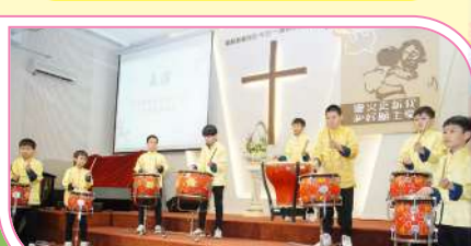
欣當區內小學表演中樂——扁鼓