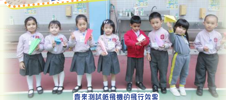
齊來測試紙飛機的飛行效果