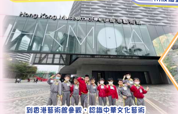
到香港藝術館參觀，認識中華文化藝術