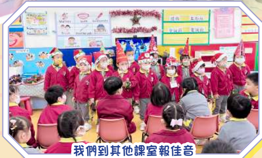
我們到其他課室報佳音