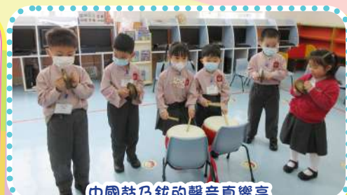
中國鼓及鈸的聲音真響亮