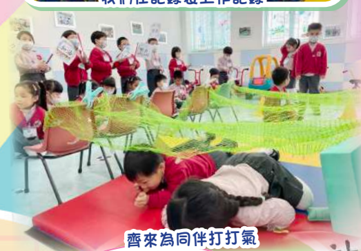
齊來為同伴打打氣