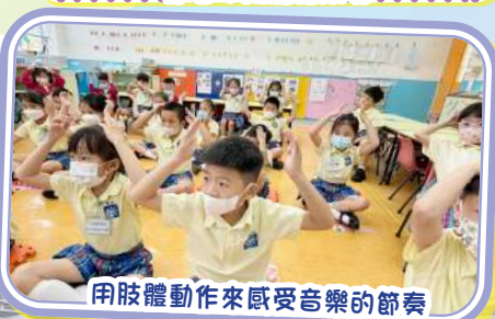
用肢體動作來感受音樂的節奏