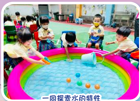
一同探索水的特性