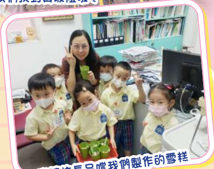
邀請校長品嚐我們製作的雪糕