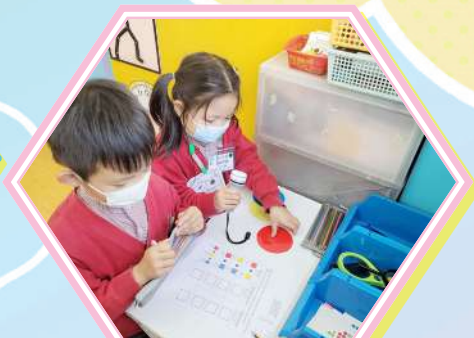
觀察光與顏色的變化