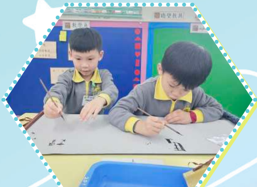
探索操控毛筆書寫文字的方法