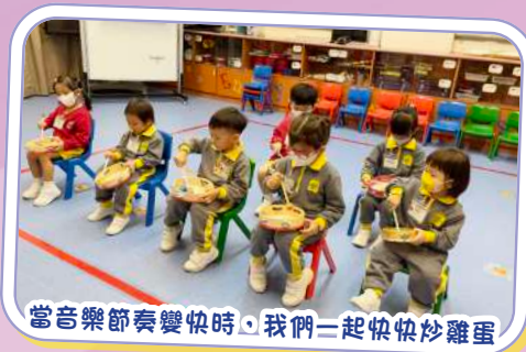
當音樂節奏變快時，我們一起快快炒雞蛋