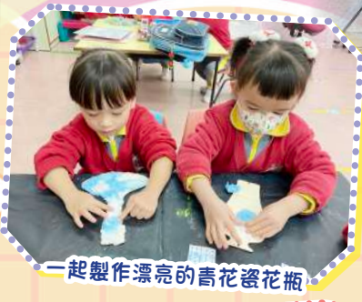
一起製作漂亮的青花瓷花瓶