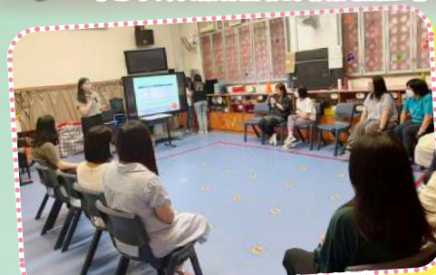
家福會主講：「保護兒童有辦法」 教師培訓講座