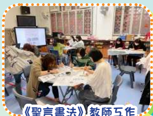
《聖言書法》教師互作

學校以聖經為基礎，致力推動幼兒認識中華文化和培養品德發展，讓兩種教育元素融入幼兒的學習課程中。通過形式多樣的培訓活動，讓教師掌握基本的中國傳統文化的知識，並開展教學實踐。開啟教師及家長在中華文化及聖經的品德教育有進一步的認識，加強幼兒品格的培育。