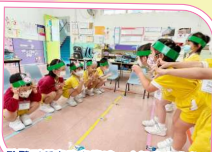
聆聽到低音的音樂時，大灰狼出現啦！