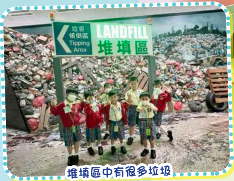
堆填區中有很多垃圾