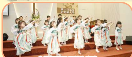
中國舞興趣班學生表演