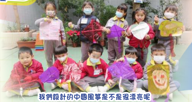
我們設計的中國風箏是不是很漂亮呢