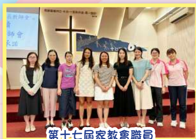
第十七屆家教會職員

本年度為第十七屆家長教師會，家長教師會職員定期與學校共同商討及籌辦不同的親子活動，促進學校與家長之間的聯繫，建立家長、教師之間的良好關係外，更攜手建立正向的思維。