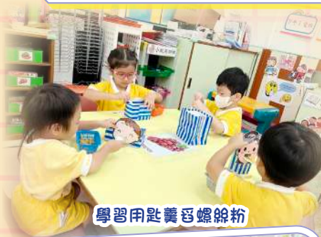
學習用匙羹舀螺絲粉