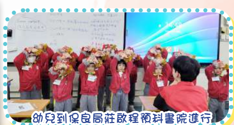
幼兒到保良局莊啟程預科書院進行報佳音表演活動