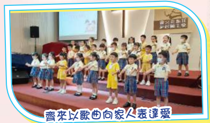
齊來以歌曲向家人表達愛