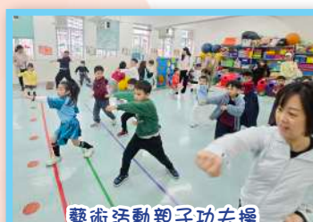
藝術活動親子功夫操