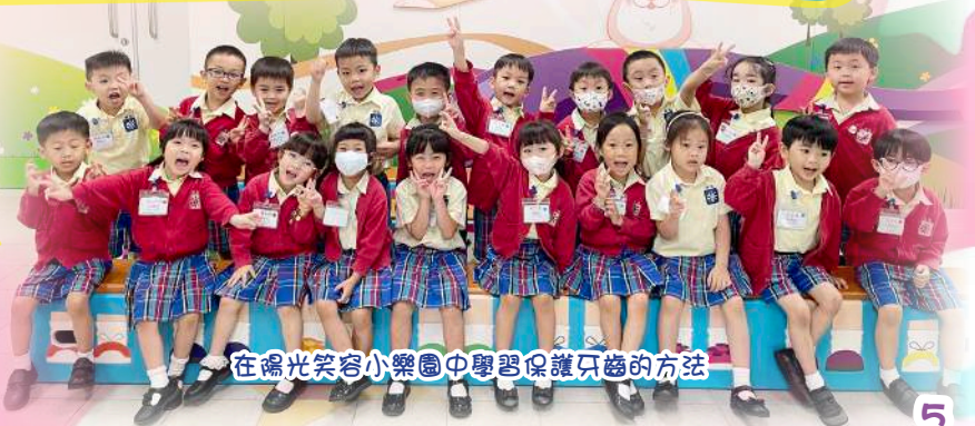
在陽光笑容小樂園中學習保護牙齒的方法