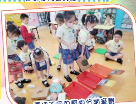
要把不同的廢物分類棄置