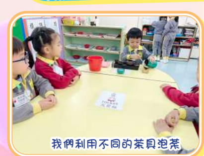
我們利用不同的茶具泡茶