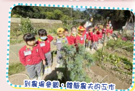
到農場參觀，體驗農夫的工作