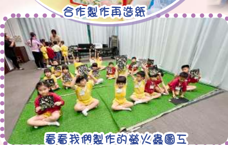
看看我們製作的螢火蟲圖