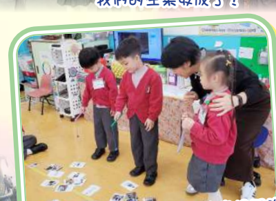
我們需要聆聽同伴的指示釣出相配的字卡