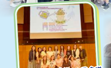
與學證基協會「第36屆全港幼稚園教師專業發展日」