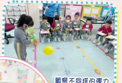
觀察不同球的彈力