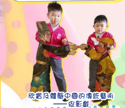
欣賞及體驗中國的傳統藝術——皮影戲