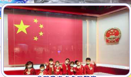
參觀國家安全展覽廳