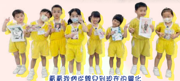
看看我們從嬰兒到現在的變化