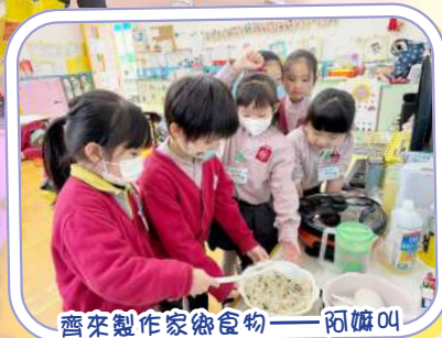
齊來製作家鄉食物——阿嫲叫