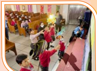
幼兒體會中國傳統民間藝術——「皮影戲」