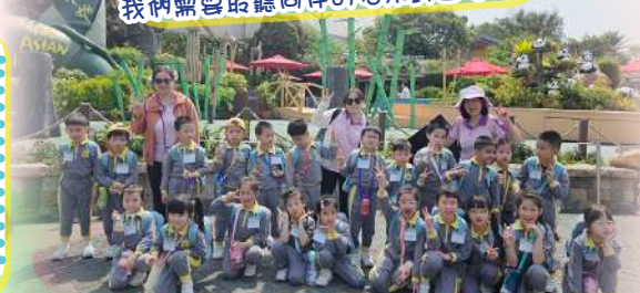
我們在海洋公園認識了很多不同的海洋生物