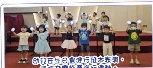
幼兒在生日會進行班本表演，跟隨音樂節奏進行律動。