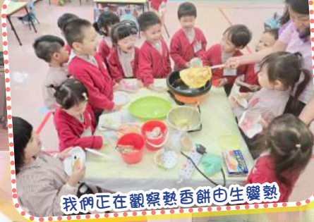
我們正在觀察熟香餅也生變熟