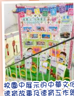
校園中展示的中華文化德育故事及德育工作紙

學校以聖經為基礎，致力推動幼兒認識及實踐中華文化的良好品德。透過中華文化的活動及培訓，讓幼兒、家長及教師除了更了解中國傳統品格故事，加強品德教育外，更開展針對不同的中華文化教學實踐，增加其接觸、欣賞及創作的機會，培養良好品格的幼兒。