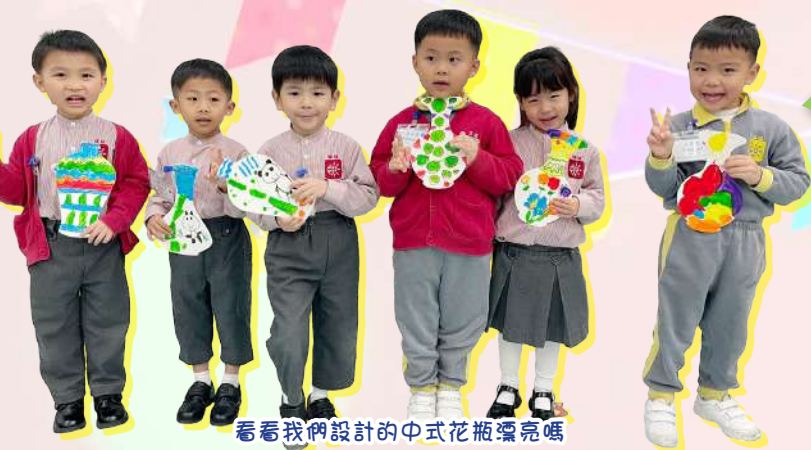
看看我們設計的中式花瓶漂亮嗎

為幫助幼兒認識和感受中華文化，並加強對國民身份的認同，本校會透過主題學習、生活體驗、親子活動、參觀活動等，將中華文化及國家安全教育的學習元素融入課堂活動，例如：讓幼兒進行升旗禮、穿華服、欣賞中國傳統藝術「皮影戲」、製作中國傳統的家鄉食品、中秋花燈、揮春、剪紙、中式花瓶和水墨畫等，設計多元化的素材和學習活動，讓幼兒認識和體驗，並享受其中的學習樂趣。