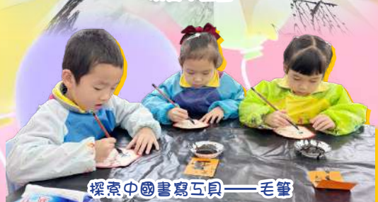
探索中國書寫工具——毛筆