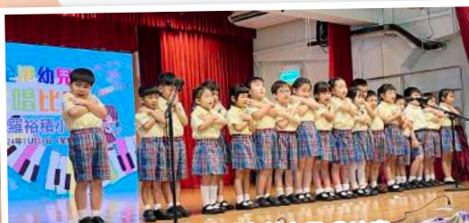
幼兒參加全港幼兒英文歌唱比賽