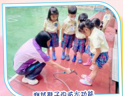
測試鞋子的防水功能