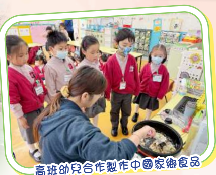
高班幼兒合作製作中國家鄉食品