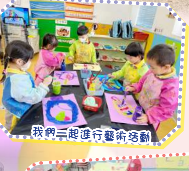
我們一起進行藝術活動