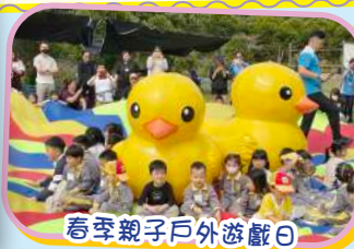
春季親子戶外遊戲日