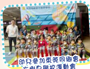
幼兒參加東莞同鄉會方樹泉學校運動會