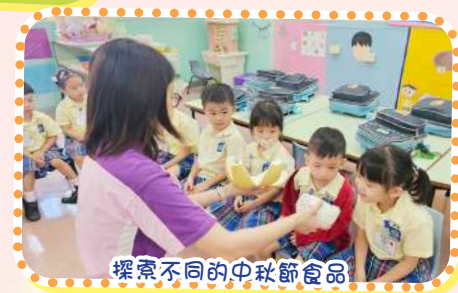
探索不同的中秋節食品