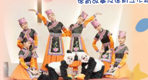
欣賞小學哥哥姐姐在中華藝術活動中表演中國舞