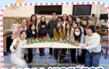
香港盆景協會「瓶景體驗工作坊」