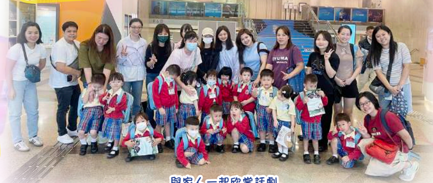
與家人一起欣賞話劇