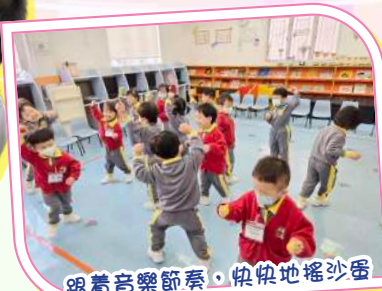
跟着音樂節奏，快快地搖沙蛋