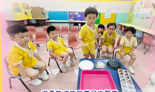
探索敲打不同碟子的聲音