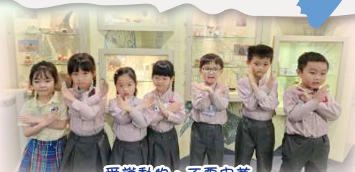
愛護動物、不要皮草