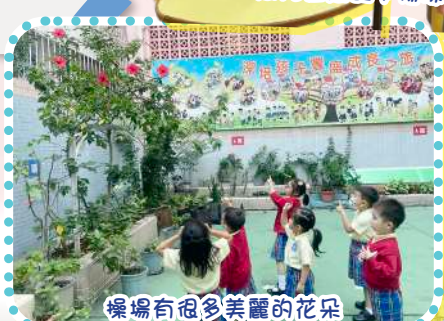
操場有很多美麗的花朵