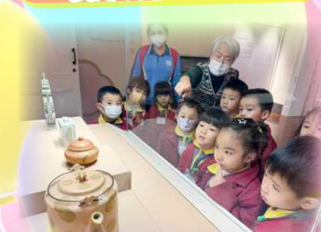
我們專注地聆聽導賞員介紹不同的茶具