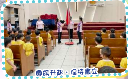
國旗升起，保持肅立