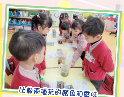
比較兩種茶的顏色和香味