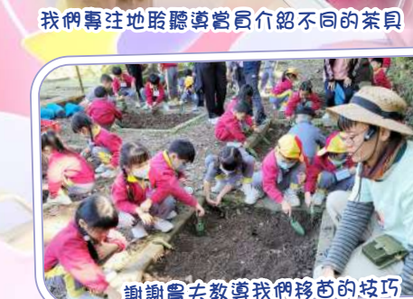
謝謝農夫教導我們移苗的技巧