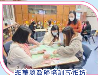
非華語教師培訓工作坊