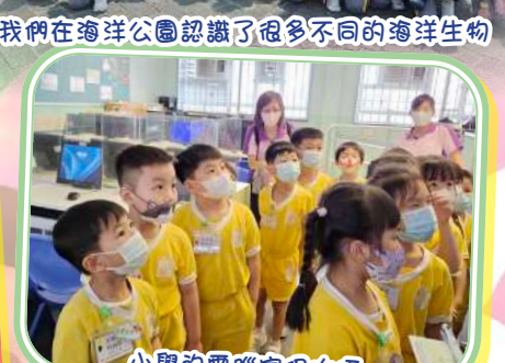
小學的電腦室很大呀