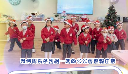
我們與哥哥姐姐一起向公公婆婆報佳音