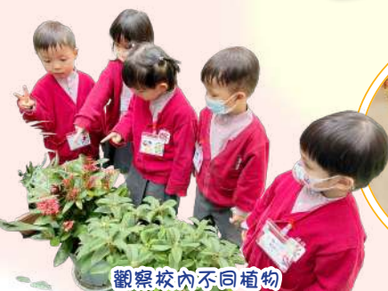
觀察校內不同植物