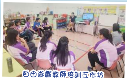
自由遊戲教師培訓工作坊