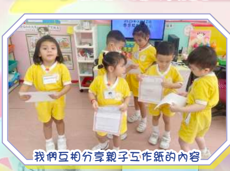
我們互相分享親子工作紙的內容