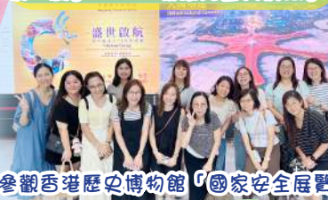
參觀香港歷史博物館「國家安全展覽廳」