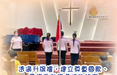
透過升旗禮，建立尊重國歌、國旗及升旗儀式的態度