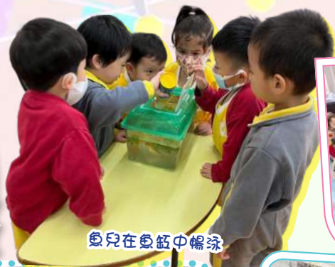
魚兒在魚缸中暢泳