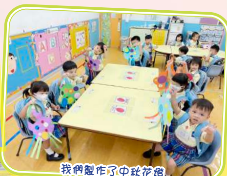
我們製作了中秋花燈