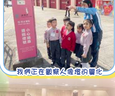
我們正在觀察人臉燈的變化