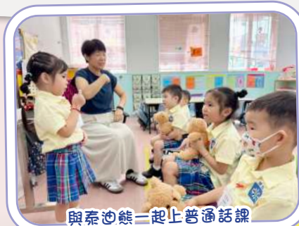
與泰迪熊一起上普通話課