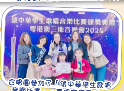
合唱團參加了「嶺中華學生歌唱音樂比賽頒獎典禮 粵港澳三地音樂會2025」音樂比賽，表現充滿自信。