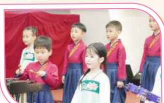
中國舞興趣班幼兒、舞蹈團和合唱團在學校藝術活動「深培藝藝傳主愛 中華承傳動起來」的表演。