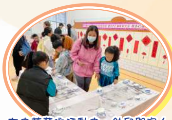
在中華藝術活動中，幼兒與家人一同欣賞幼兒製作的青花瓷茶具