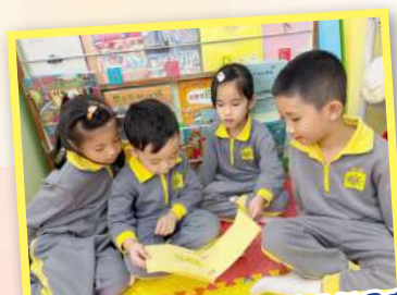
幼兒在課室圖書角中閱讀自製圖書