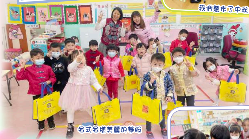
各式各樣美麗的華服