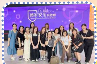
在教師發展日，教師一同參觀「國家安全展覽廳」