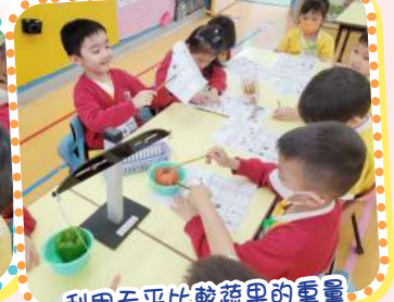
利用天平比較蔬果的重量