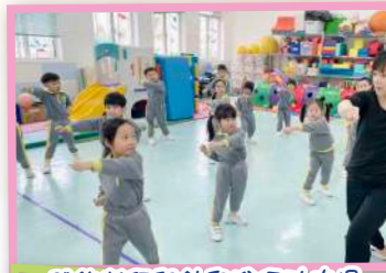
體能老師與幼兒進行功夫操