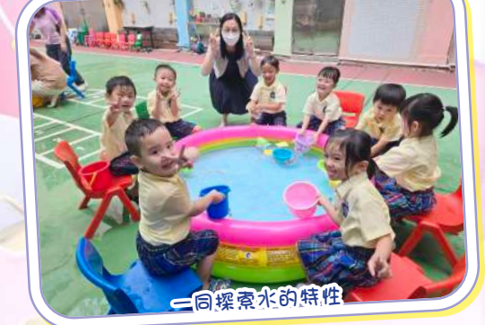
一同探索水的特性