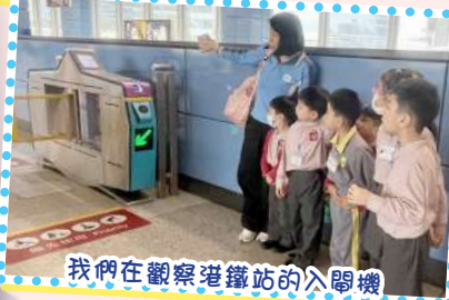
我們在觀察港鐵站的入關機