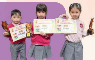
幼兒參加了三扶教育中心主辦「中華基督教會香港區會第四屆全港朗誦比賽（獨誦）」

學校致力推動幼兒的全人發展，透過鼓勵與支持幼兒參與社區及校內舉辦的活動和比賽，展現幼兒的能力，培養自信心。