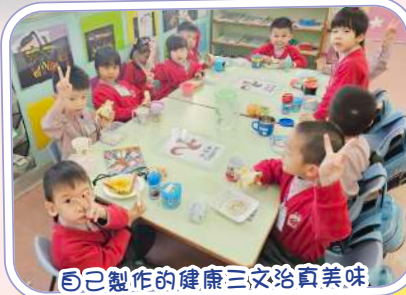
自己製作的健康三文治真美味