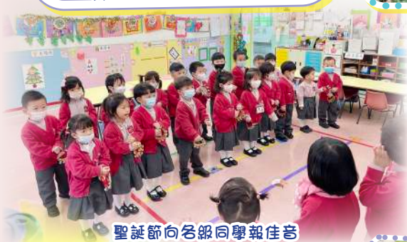
聖誕節向各級同學報佳音