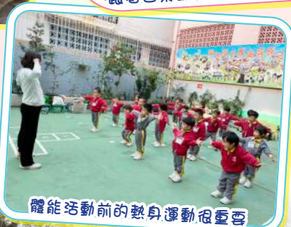
體能活動前的熱身運動很重要