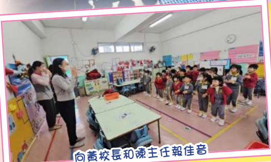
向黃校長和陳主任報佳音