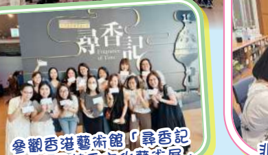
參觀香港藝術館「尋香記——中國芳香文化藝術展」