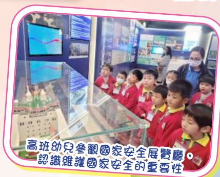
高班幼兒參觀國家安全展覽廳，認識維護國家安全的重要性