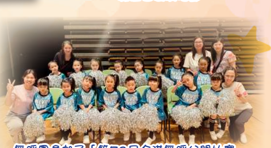
舞蹈團參加了「第53屆全港舞蹈公開比賽」