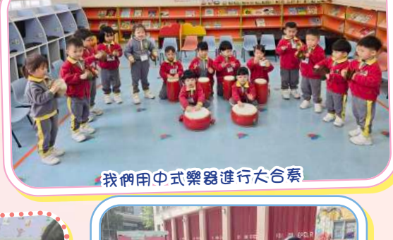
我們用中式樂器進行大合奏