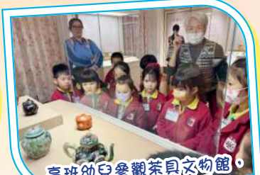
高班幼兒參觀茶具文物館，認識中國傳統茶具