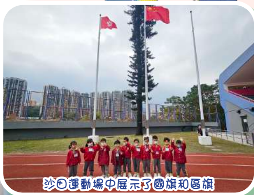
沙田運動場中展示了國旗和區旗