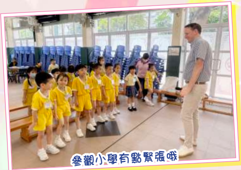
參觀小學有點緊張哦