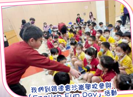
我們到路德會沙崙學校參與「English Fun Day」活動