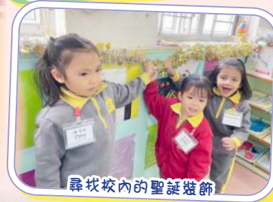
尋找校內的聖誕裝飾