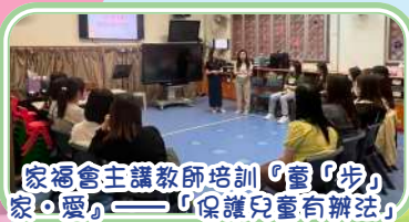
家福會主講教師培訓「愛『步』家『愛』——『保護兒童有辦法』」

學校安排教師參加校外及校內不同機構舉辦的工作坊或講座，包括參與香港盆景協會「瓶景體驗工作坊」，讓教師認識和設計中華文化元素的瓶景造型，亦安排參觀香港藝術館、香港歷史博物館、國家安全展覽廳及科學館，讓教師欣賞中國藝術品、了解維護國家安全的重要性及中國在科學上的成就，並安排澳門幼教學習交流團，讓教師認識澳門幼稚園推行中華文化及家國情懷培養的方法，同時透過自由遊戲及非華語教師工作坊，加強相關的設計概念和教學技巧等。更安排不同社福機構和專業人士到校進行講座，透過不同工作坊、講座和其他形式的學習，豐富老師的專業知識，以保持優化教學質素，建立專業型學習團隊。