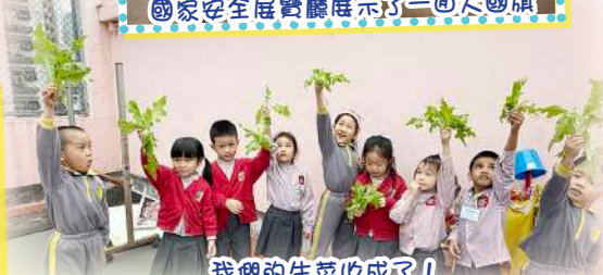
我們的生菜收成了！