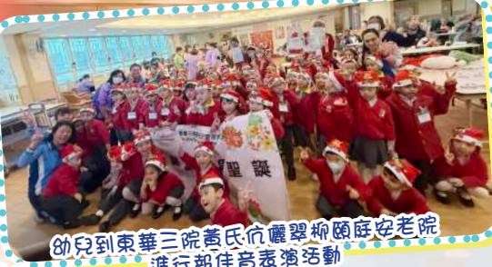
幼兒到東華三院黃氏衍慶翠柳庭安老院進行報佳音表演活動