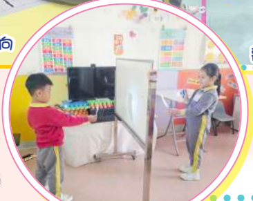
利用電筒探索物件的影子