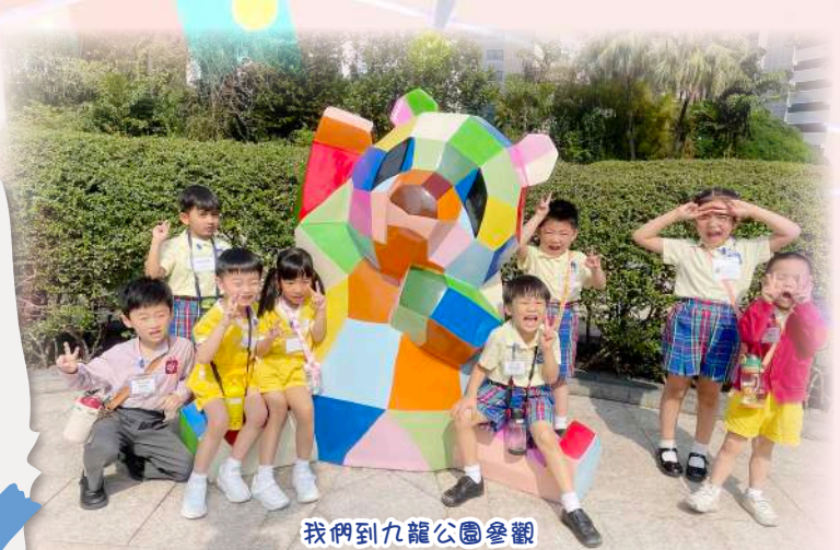
我們到九龍公園參觀