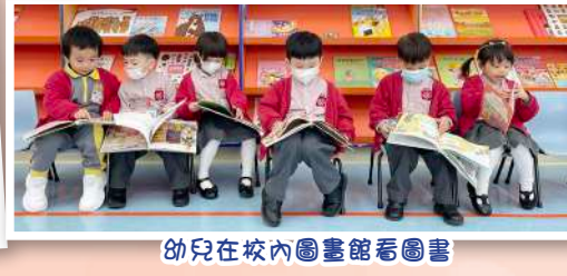
幼兒在校內圖書館看圖書