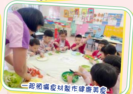
一起預備食材製作健康美食