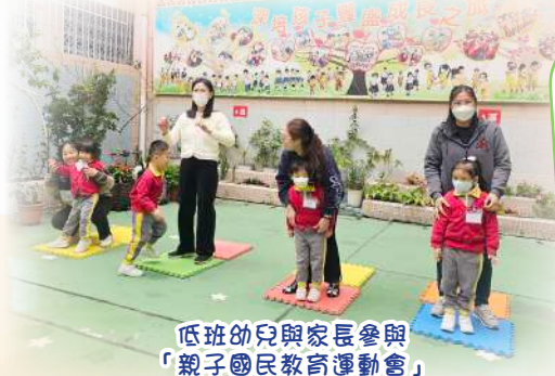
低班幼兒與家長參與「親子國民教育運動會」