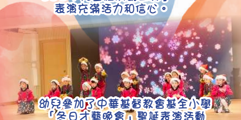
幼兒參加了中華基督教會基全小學「冬日才藝晚會」聖誕表演活動