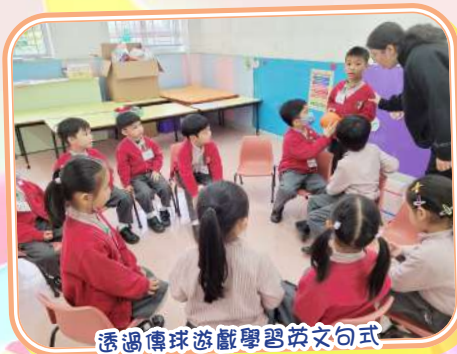
透過傳球遊戲學習英文句式