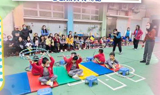
親子深培國民教育運動會