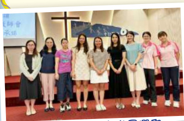
第十八屆家長教師會職員選舉