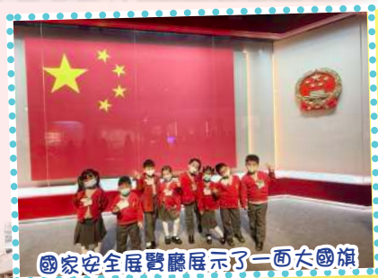
國家安全展覽廳展示了一面大國旗