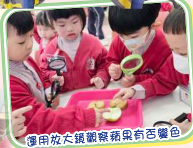
運用放大鏡觀察蘋果有否變色