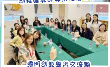
澳門幼教學習交流團