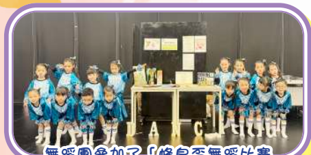
舞蹈團參加了「蜂鳥盃舞蹈比賽2025-兒童組別爵士舞」，表演充滿活力和信心。