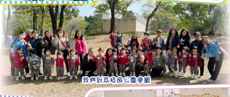
我們到荔枝角公園參觀