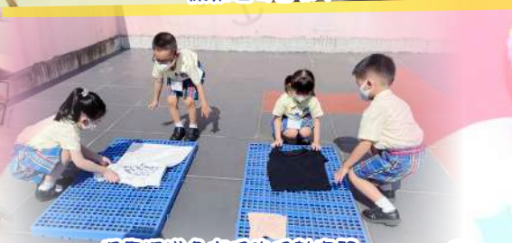
探索深淺色衣服的吸熱實驗