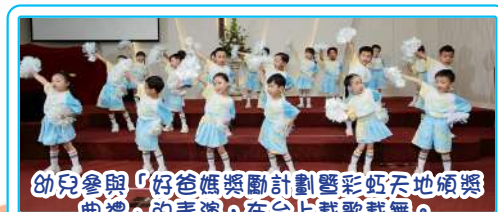
幼兒參與「好爸爸獎勵計劃暨彩虹天地頒獎典禮」的表演，在台上載歌載舞。