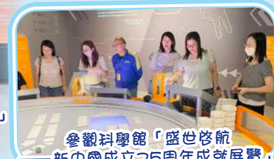
參觀科學館「盛世啟航——新中國成立75周年成就展覽」