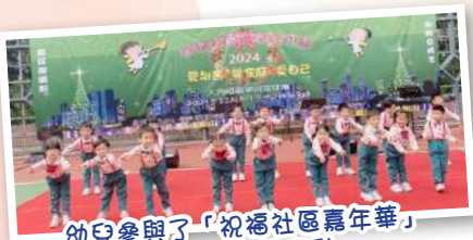
幼兒參與了「祝福社區嘉年華」之聖誕表演活動