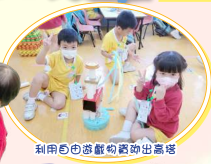
利用自由遊戲物資砌出高塔