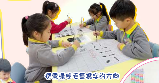
探索操控毛筆寫字的方向