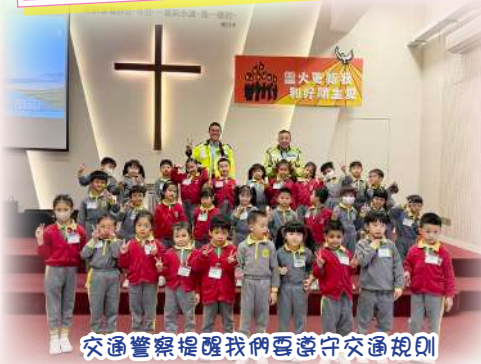
交通警察提醒我們要遵守交通規則